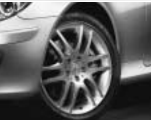
18" Felge, 6-Doppelspeichen-Design ▼