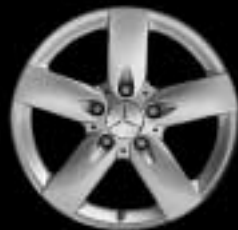
▲ 5-Speichen-Design (Code 606)