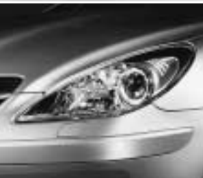
Scheinwerfereinfassung dunkel ▲