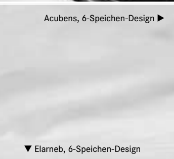
Acubens, 6-Speichen-Design ▶