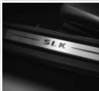
◀ Beleuchtete Einstiegsschienen