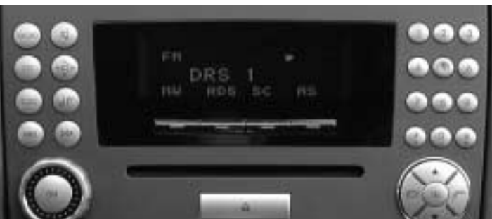
◀ Radio »Audio 20«