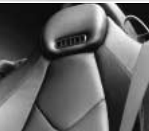
Sitze mit roter Ziernaht ▲