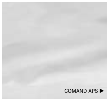
COMAND APS ▶