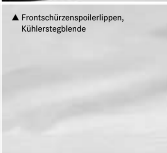
▲ Frontschürzenspoilerlippen, Kühlerstegblende