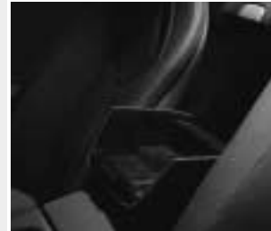
▲ Ablagebox an der Rückwand