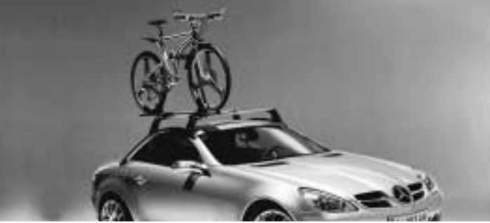
◀ Grundträger New Alustyle, Fahrradhalter New Alustyle