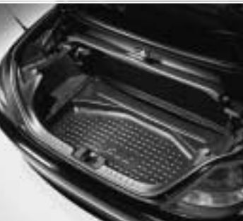
◀ Kofferraumwanne, flach