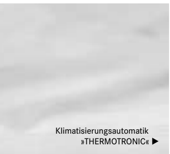
Klimatisierungsautomatik »THERMOTRONIC« ▶