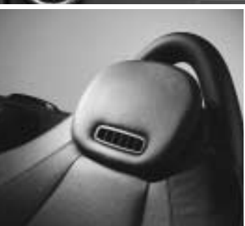
◀ AIRSCARF, Kopfraumheizung