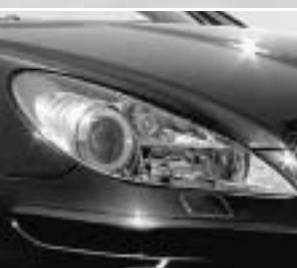
Scheinwerfer in Klarglas ▲