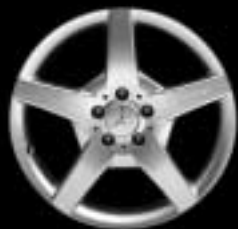
▼ 5-Speichen-Design AMG