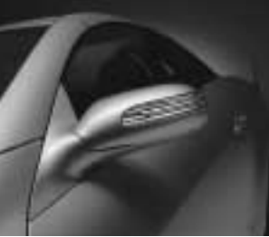
Blinkleuchte in Außenspiegel ▲