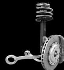
▲ AMG Performance Fahrwerk