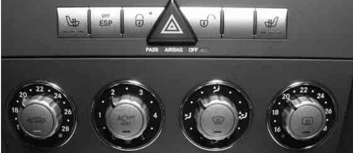
Klimaanlage »THERMATIC« ▶