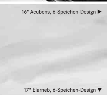
16" Acubens, 6-Speichen-Design ▶