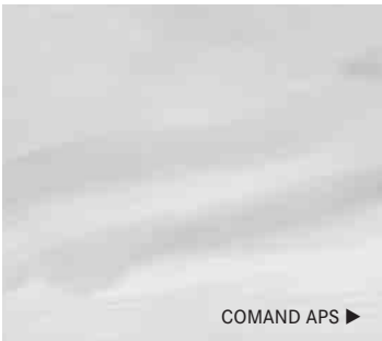
COMAND APS ▶