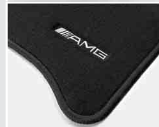
▼ AMG Fußmatte