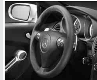
▲ AMG Ergonomie-Sportlenkrad