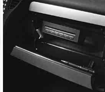
◀ CD-Wechsler im Handschuhfach