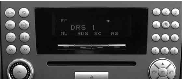
◀ Radio »Audio 20«