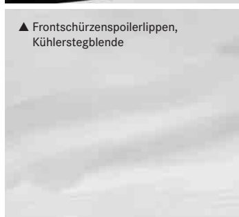
▲ Frontschürzenspoilerlippen, Kühlerstegblende