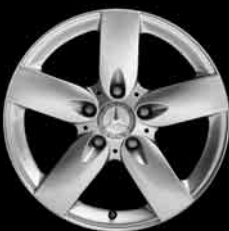
5-Speichen-Design (1R4) ▲