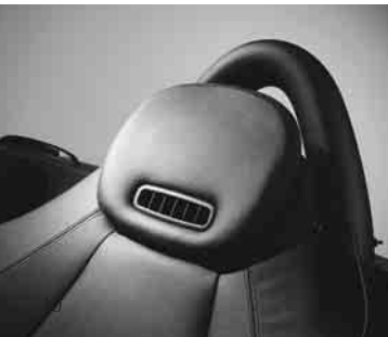
◀ AIRSCARF, Kopfraumheizung