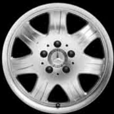
7-Speichen-Design (1R6) ▲