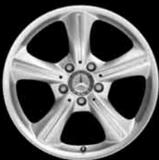
5-Speichen-Design (1R5) ▲