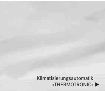
Klimatisierungsautomatik »THERMOTRONIC« ▶