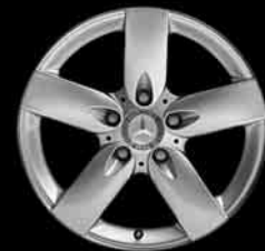
▲ 5-Speichen-Design (Code 606)