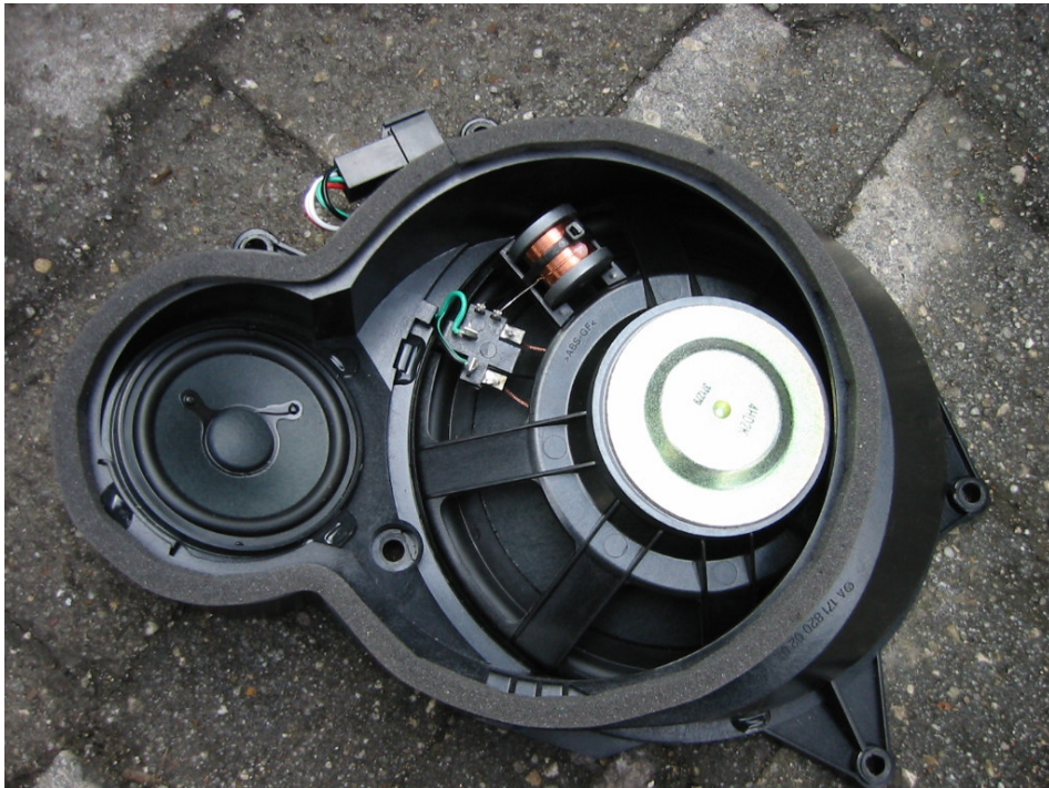
Die Vorderansicht des Tieftöners ( zum Wageninnenraum ) Durchmesser des TT ~ 200 mm Durchmesser des MT ~ 80 mm