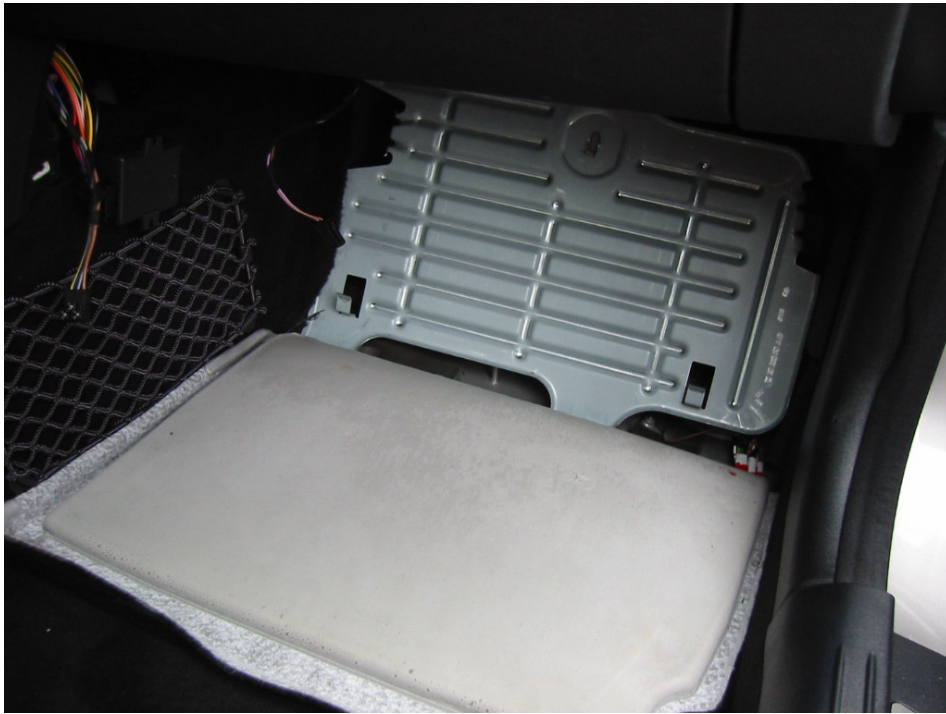
Beifahrerfußraum noch mit Stützblech ( 3 Kunststoffmuttern )