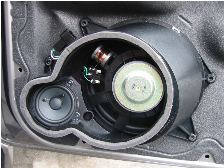
Der Tieftöner und sein kleiner Bruder – mit einfachsten Frequenzweichen getrennt