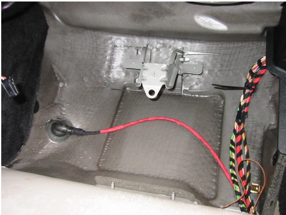
Beifahrerfußraum ohne Blechstütze