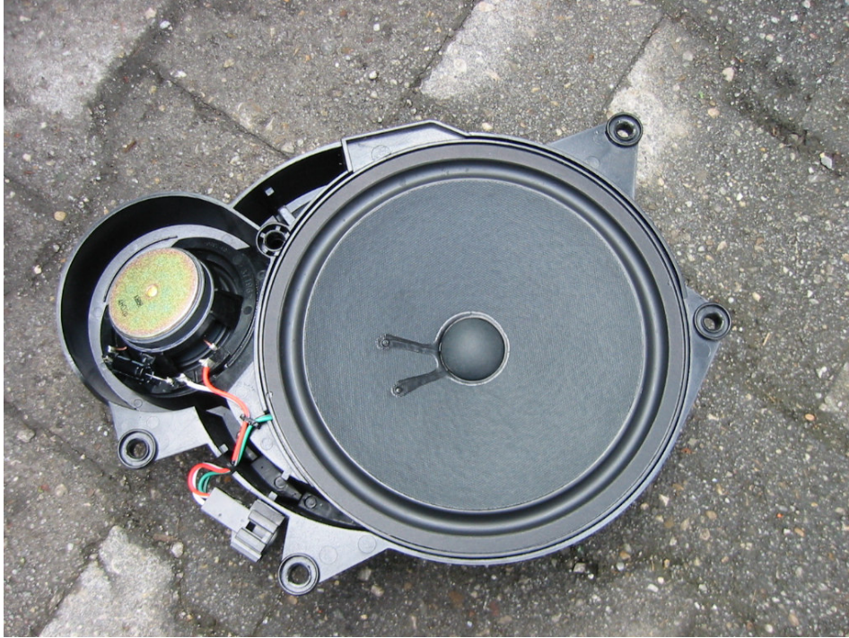
Die Rückansicht ( zum Türinnern gerichtet ) des Tieftöners