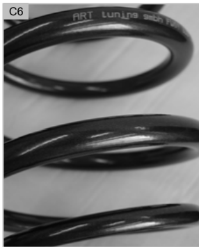
fig. C4 C5 C6