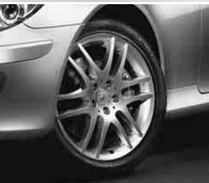
18" 6-Doppelspeichen-Design ▼