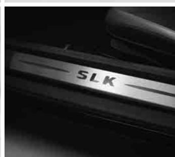
◀ Beleuchtete Einstiegsschienen