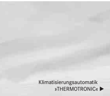
Klimatisierungsautomatik »THERMOTRONIC« ▶