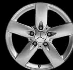
▲ 5-Speichen-Design (Code 606)