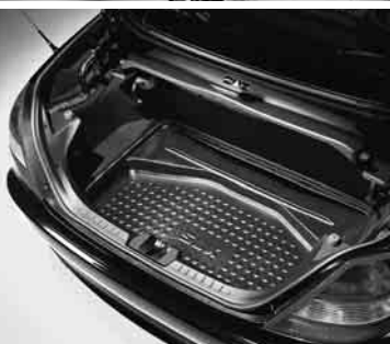
◀ Kofferraumwanne, flach