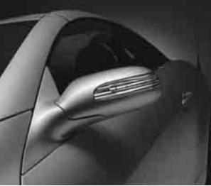
Blinkleuchte in Außenspiegel ▲