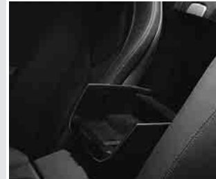
▲ Ablagebox an der Rückwand