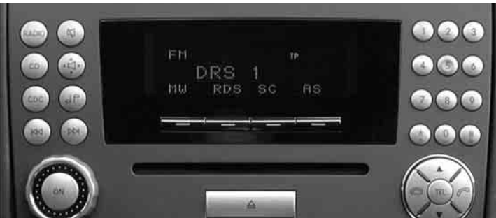
◀ Radio »Audio 20«