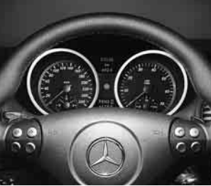
Kombiinstrument mit roten Zeigern ▲