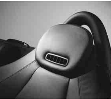
◀ AIRSCARF, Kopfraumheizung