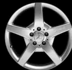
▼ 5-Speichen-Design AMG