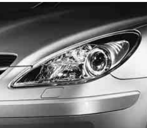
Scheinwerfereinfassung dunkel ▲