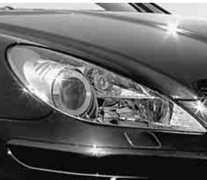
Scheinwerfer in Klarglas ▲