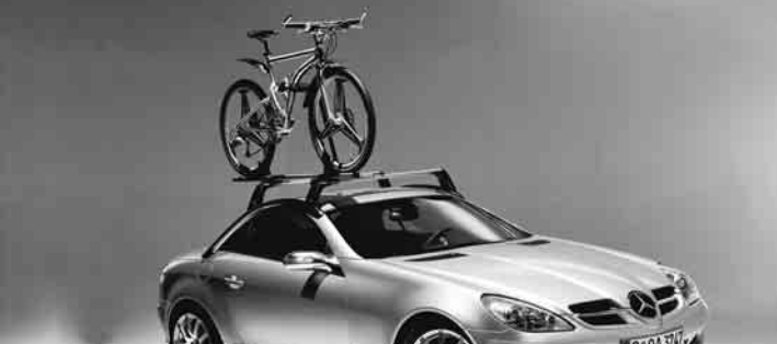
◀ Grundträger New Alustyle, Fahrradhalter New Alustyle