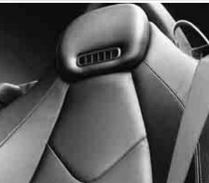
Sitze mit roter Ziernaht ▲