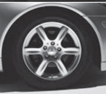
◀ 16" Acubens, 6-Speichen-Design