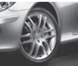
18" 6-Doppelspeichen-Design ▼