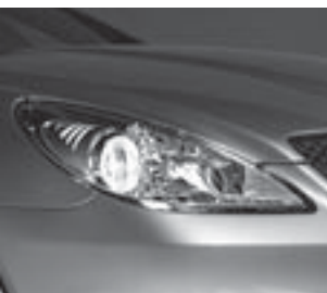
Scheinwerfer in Klarglas ▲