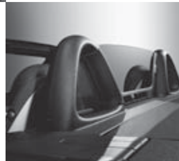
▲ Windschott transparent