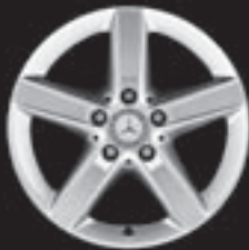
5-Speichen-Design (R19) ▲