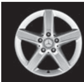
▲ 5-Speichen-Design (1R4)