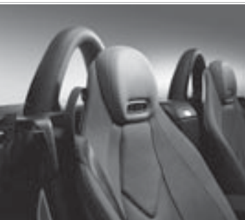
◀ AIRSCARF, Kopfraumheizung