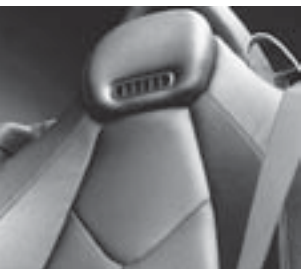
Sitze mit roter Ziernaht ▲