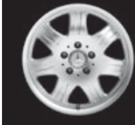
▲ 7-Speichen-Design (1R6)

* tagesaktuelle Konditionen unter www.mercedes-benz-bank.de (siehe Hinweis auf Seite 4)