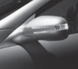
Blinkleuchte in Außenspiegel ▲