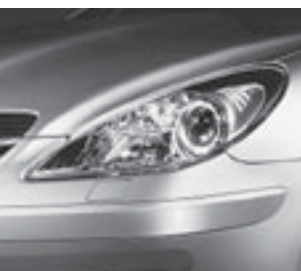
Scheinwerfereinfassung dunkel ▲