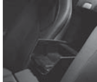
▲ Ablagebox an der Rückwand