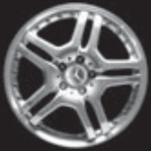
AMG Doppelspeichen-Design ▲