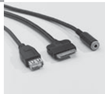
◀ Media Interface Consumer-Kabel Kit