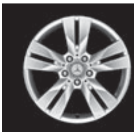
▲ 5-Doppelsp.-Design (1R7)