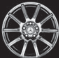
10-Speichen-Design (R93) ▲