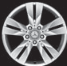
5-Doppelspeichen-Design (R52) ▲