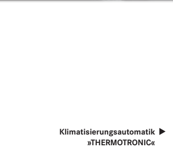
Klimatisierungsautomatik ▶ »THERMOTRONIC«