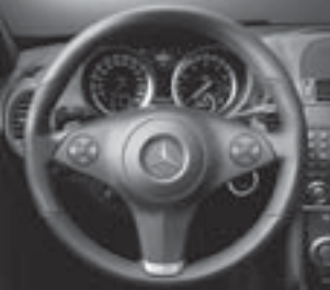
Kombiinstrument m. roten Zeigern ▲