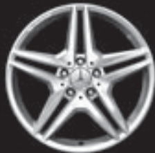
AMG 5-Doppelsp.-Design (795) ▼