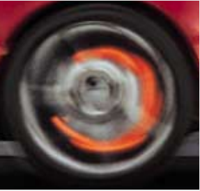
AMG Leichtmetallräder sorgen unter anderem für eine bessere Kühlung der Bremsanlage.

Sportliches Zubehör wird nicht zuletzt gebaut, um das Herz ein paar Takte höher schlagen zu lassen. Richtig genießen kann man es allerdings nur, wenn die Technik alles sicher im Griff hat.