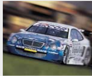
Vom Rennsport in die Serie: Ausgefeilte Aerodynamik erhöht den Abtrieb des Fahrzeugs und optimiert die Straßenlage bei höherem Tempo.

Dass darüber hinaus alle Anbauteile mit dem Design des jeweiligen Mercedes harmonieren und niemals aufgesetzt oder aufdringlich wirken, ist für uns auch eine sportliche Herausforderung.