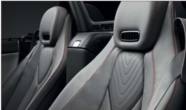
Sitzfläche in edlem Leder Nappa basaltgrau mit roten Kontrastziernähten und Seitenwangen in Leder designo basaltgrau pearl.