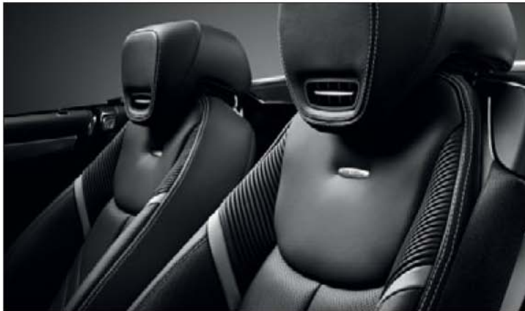
Die neu designten Sitze mit pfeilförmig verlaufenden Nähten, silberfarbenen Kontrasten und Editionsemlern.