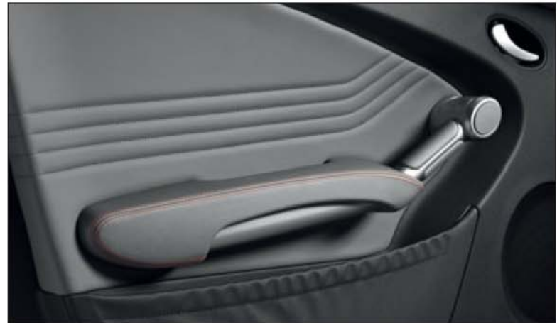
Türmittelfeld in Leder Nappa basaltgrau und Armauflage in Leder designo basaltgrau pearl.