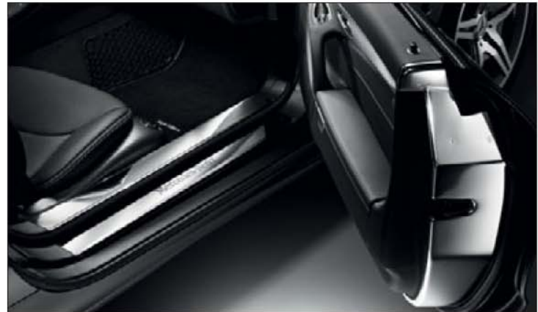
Die verchromte, hochglänzende Einstiegsleiste und Türverriegelung sowie das Editionsemlern auf der Fußmatte.

Zur weiteren Individualisierung steht Ihnen – von wenigen Ausnahmen abgesehen – unser umfassendes Sonderausstattungsangebot zur Verfügung. Weitere Informationen erhalten Sie von Ihrem Mercedes-Benz Partner.